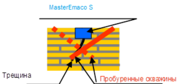
Рисунок 1 Примерная технология инъекции трещин.